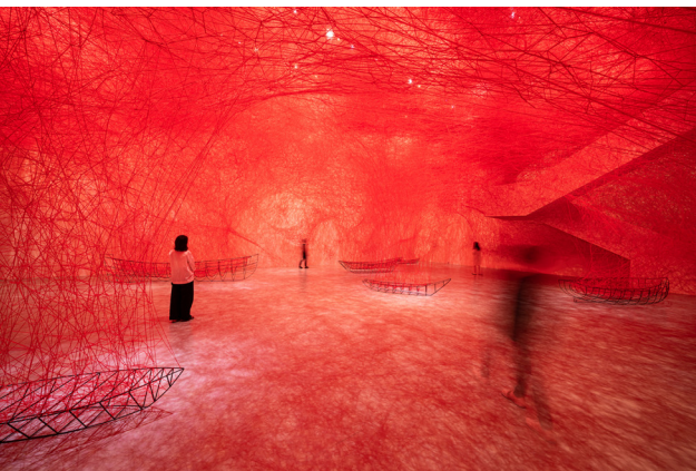
Chiharu Shiota, Uncertain Journey , 2021

LES ÉVÉNEMENTS À NE PAS MANQUER | NOT-TO-MISS EVENTS